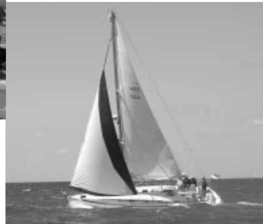
Waternimf in actie op het IJsselmeer

grond. Ook op de Noordzee zagen we een lange sliert zeiljachten op weg naar IJmuiden. Het leek wel een ganzenpas, netjes ver uit de kust en achter elkaar aan met stroom tegen. Een bescheiden tip... stroom tegen... zeil zo dicht mogelijk onder de kust. Hier heeft u het minst last van de tegenstroom. Eenzaam voeren wij onder de kust en liepen het veld voorbij. Zodra het tij kenterde kozen ook wij voor de volle zee, om optimaal te profiteren van de meegaande stroom. Waternimf kwam niet meer onder de 10 knopen. Om 4 uur passeerden wij de finish.