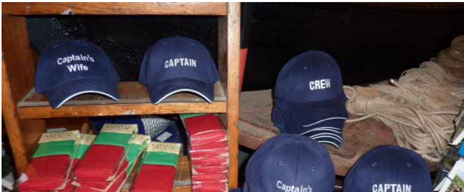
Het seizoen 2015 lokt

'Heb je dat al gezien? De Cayenne zeilde vandaag van Scheveningen naar Dover in één ruk. Ze hadden de wind en het weer wel mee deze tocht.' Mijn kapitein is verdiept in de bewegingen die hij ziet op de 'App' Marinetraffic. Zouden ze achter de eerste deur liggen of in het woelige water ervoor? Wij lagen jaren geleden voor het eerst in Dover. Een mooi plekje in een box, maar plots een dichte sluisdeur. Vele dagen blies de wind je ongeveer uit je zeiljack. Dover, herinneringen aan de 'White Cliffs', het kasteel boven op de berg, fish en chips, een treinreisje naar Londen en kijken naar de weerberichten. 'Goh, ze zijn al weer onderweg! Kijk, ze zeilen nu naar Cherbourg. Heb jij de Aegir alweer in beeld? Hé, die varen op het Sont bij Kopenhagen. Vreemd? Ze wilden toch naar de Oostkust van Zweden. Zouden ze van gedachten zijn veranderd?' Ik kijk op hun blog en lees dat ze andere keuzes maken vanwege de wind. Ze treffen het wel, wat een mooi weer in Denemarken. Dat is anders dan wij hadden destijds. "Sorry", zei een Deens echtpaar als excuus voor het slechte weer, alsof het hun schuld was.