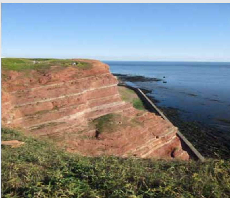
Helgoland met de karakteristieke rode rotsen

Tegen de wind in, zelfs bij windkracht 4, is dit geen fijn water. We ploeteren urenlang naar het oosten en zijn toch te laat om de Elbe op te kunnen. We kijken uit naar Helgoland en dat blijkt een onverwacht prettige verrassing. Het kleine eiland heeft een prachtige natuur – loop vooral de route die het hele eiland omvat – en een geweldige historie. Een tussenstop die het omvaren waard is. Daarna volgen weer een aantal dagen motoren. Eerst de Elbe op met veel stroom mee maar weinig wind, dan het eindeloze Noord-Oostzee kanaal af. De tussenstop in Rendsburg is een welkome pauze. Als we de sluizen van Holtenau uitvaren, komen we in het prachtige Kieler Fjörde dat bijna aandoet als binnenwater tot je de reusachtige cruiseschepen en tankers ziet passeren.