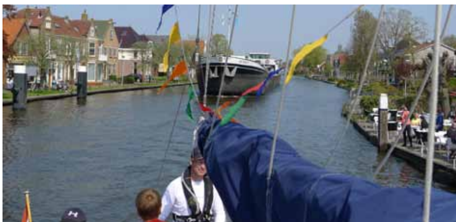
Mensen kijken hun ogen uit naar alle soorten en maten boten die vlak langs het terras varen