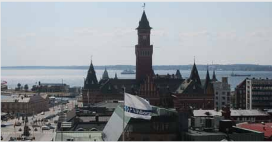
Uitzicht over de Sont vanaf de Zweedse kant (Helsingborg) met uitzicht op de Deense kant (Helsingor)

drukte wordt het tijd om het weidse water weer op te zoeken. We trekken verder naar het zuiden en komen langs de beroemde witte kliffen van Møn, die zeker van dichtbij indrukwekkend zijn. Als we het Småland vaarwater opgaan, worden we verrast door harde wind die toeneemt tot een dikke windkracht 7. We komen terecht in de vissershaven van Stubbekøbing, waar we een onrustig nachtje hebben en een zwarte afdruk van de autobanden meekrijgen die aan de kademuur zijn bevestigd.