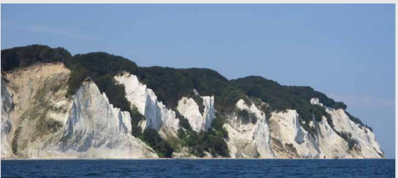
De beroemde krijtotsen van Møn

In Kopenhagen gaan we op goed geluk de smalle kanalen van Christianshavn in en vinden een prachtig plekje aan de kant. Het is alsof je in Amsterdam aan de Keizersgracht ligt: midden in de stad in een smal kanaal met uitzicht op fietsende mensen over de met kasseien bedekte kade. We genieten van de stad, bezoeken natuurlijk Tivoli en maken zoals iedereen foto's van onze haven vanaf de bijzondere torenspits van de Vor Frelsers Kirke. Na drie dagen stadse