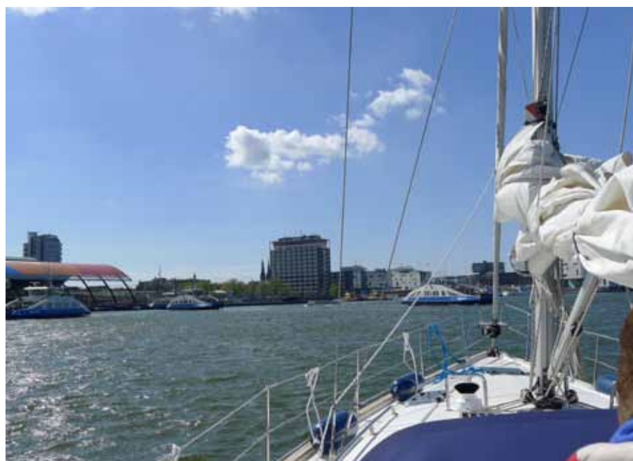
Druk verkeer op het IJ in Amsterdam

De eerste brug passeren we zonder problemen. Bij het aanvaren van de Oranjesluizen duurt het even, voordat ik de situatie goed in beeld heb. Beroepsverkeer vaart in en uit en met de kaart in de hand en vele helpende ogen aan boord, leggen we veilig aan bij de sport van de jachtensluis. We luisteren via de marifoon naar de aanwijzingen van de sluismeester en vervolgen onze vaarroute door Amsterdam.