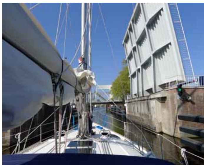
De Haarlemse brugwachter op de fiets opent opeenvolgende bruggen