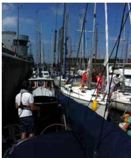
Ervaren schippers in de Grevelingensluis

De Grevelingensluis vult zich met wel dertig boten en dat zonder problemen; allemaal ervaren schippers. De toeschouwers op de kade krijgen alleen een vrolijke schakering boten met behendige bemanning te zien. Er klinkt opgewonden geroezemoes in de sluis en spannende blikken houden de slippende lijnen in