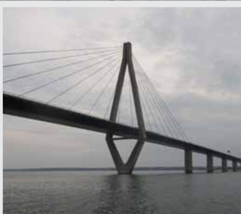
Veel eilanden zijn verbonden door enorme bruggen

Het complete reisverslag is te lezen op zeiljachtaegir.nl