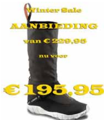
Lizard Spin Zeillaarzen