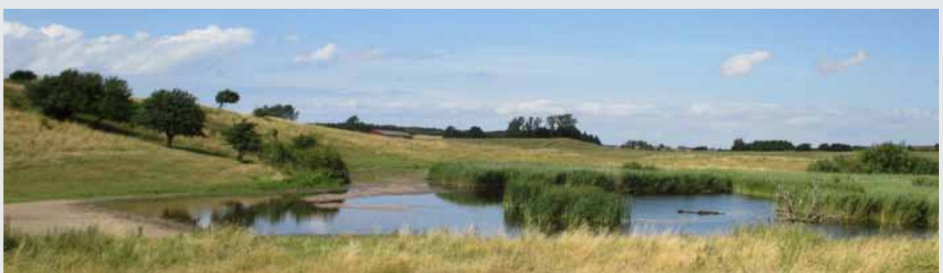
Schitterende natuur op het eiland Samsø