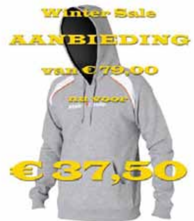
Curver Sweat Men