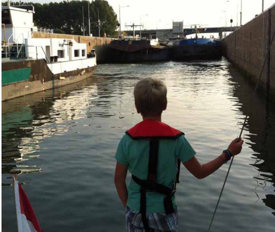
Beroepsvaart sluit langzaam de Beato in

Na een mooie vakantie op de Grevelingen varen we terug naar onze thuishaven 'De Batterij' in Willemstad. We vertrekken vanuit jachthaven 'Bruinisse' en sluiten meteen aan bij alle andere recreanten voor de Grevelingensluis. We moeten een ronde wachten. Het is altijd gezellig om ervaringen uit te wisselen met de schipper langszij. De storm van vannacht is het onderwerp van gesprek. Hij had een nachtelijk avontuur met een krabband anker, terwijl wij rustig in een box lagen. We zijn niet jaloers.