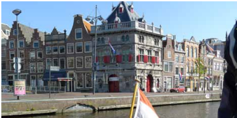
Vredige stilte op zondagochtend in de stad; Bevrijdingsdag in Haarlem