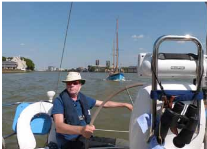
The Lame Duck op sleeptouw op de Thames

En dan het eerste zicht op de gebouwen van de Docklands. We moeten ons melden voor the Thames Barrier. En even later varen we ruim op tijd voor het lock hour de "bebouwde kom" van London in. Dan horen we een noodoproep.