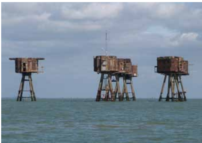
Maunsell Sea Forts / Red Sand Army Fort Thames Towers