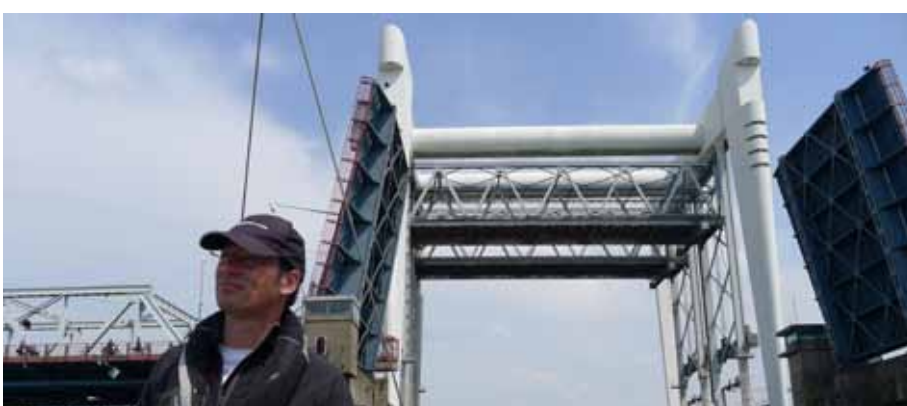
Het doet wat met je wanneer die machtige bruggen alleen voor jou opengaan