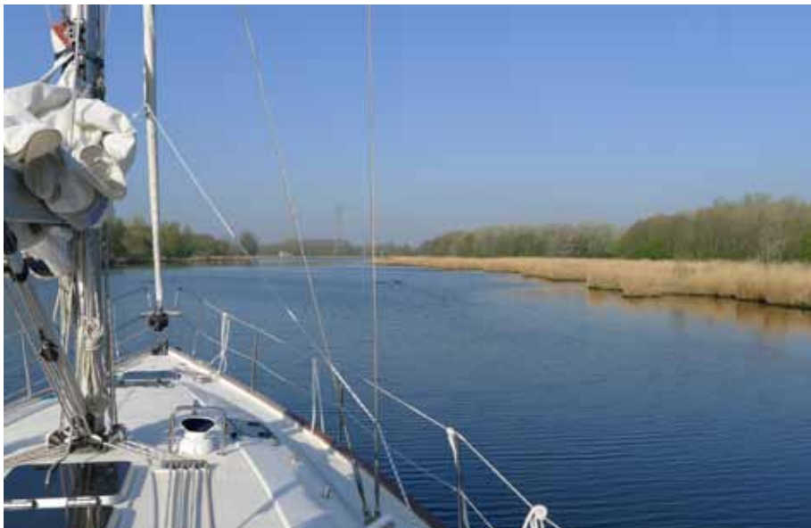
Wiegende rietkragen, een verademing na het drukke Noordzeekanaal

Om 11.00 uur gooien we los en zetten koers naar Gouda. We hebben minstens dertien verkeersbruggen in het vooruitzicht; we krijgen inmiddels handigheid in het aanleggen bij wachtplaatsen en het oproepen via de marifoon. De Hefbrug te Gouwsuis moet voor ons iets verder open vanwege onze masthoogte van 19 meter. 'Geen paniek mevrouwjtje', kraakt