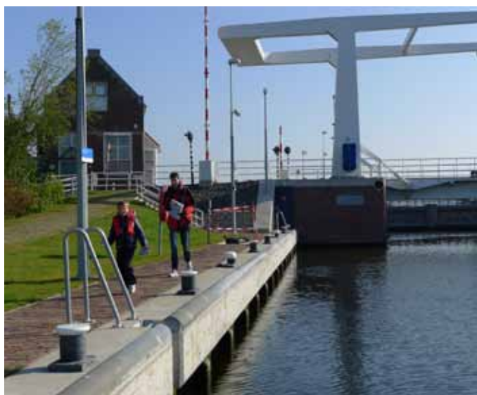
Toeristisch informatiepakket en een snoepje van de sluismeester bij de Rijnlandsluizen te Spaarwoude

de binnenvaartschepen op enkele centimeters afstand de Beato voorbij. Vol bewondering kijken we hoe de schippers hun kolos onder de bruggen doorschuiven. Onze complimenten voor de binnenvaartschippers! We bellen met de eerstvolgende haven achter de spoorbrug en vragen om een ligplaats. Veel mensen maken vanwege de late brugopening dankbaar gebruik van WV Gouda. Omdat we 1,90 m diep steken, moeten we bij de haveningang zoveel mogelijk bakboord houden. De kiel schraapt alsnog over de grond en vervolgens manoeuvreren we de Beato naast een motorschip. Hoe we hier morgen weggkomen, zien we dan wel weer. De haven stelt niet veel voor, maar is prima voor één nacht.