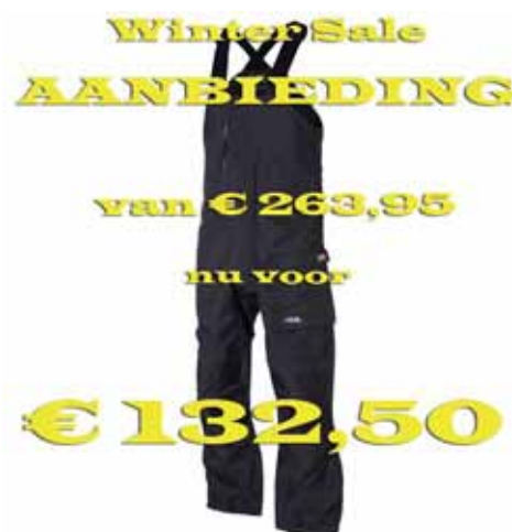
3L Overall Cape Town