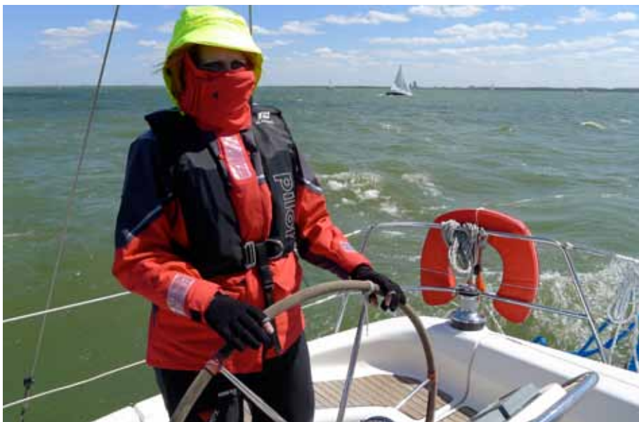
Het Markermeer heeft een mysterieus groene kleur

de zon is opgewarmd. Het ruime sop van het IJsselmeer lokt en we verlaten Friesland via de Johan Friso Sluis. Het is windstil, het water spiegelglad en we motoren naar Volendam. De bomen op de steiger staan in volle bloesem en maken het aanzicht van de haven erg romantisch. Een bos palingen mag natuurlijk niet ontbreken bij het avondeten.