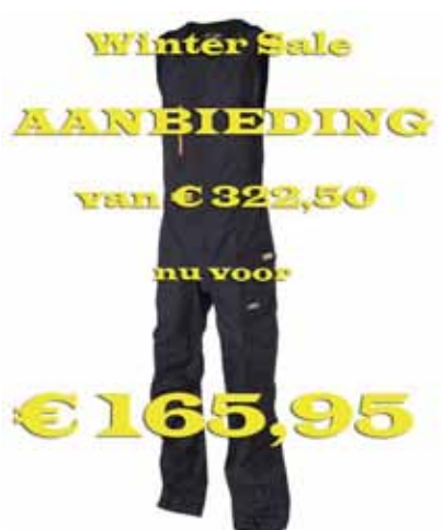
3L Salopette Wellington

En nog veel meer! Zie: http://www.webshopqsail.nl/hikashop-menu-for-categories-listing/category/286-magic-marine-winter-sales.html