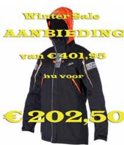
3L Continental Long Jacket