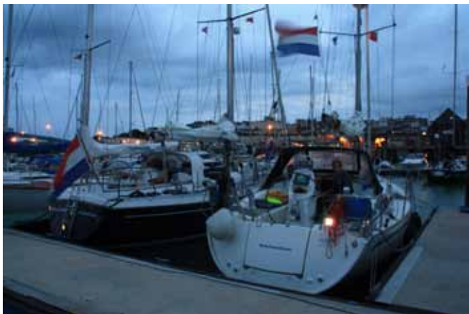
Ramsgate, vroeg in de ochtend, vlak voor vertrek