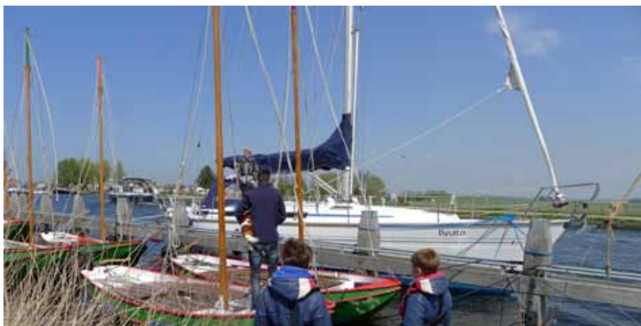
Tijd genoeg: even van boord om ons uit te leven