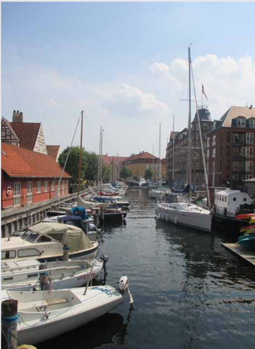
Christianshavn in het centrum van Kopenhagen