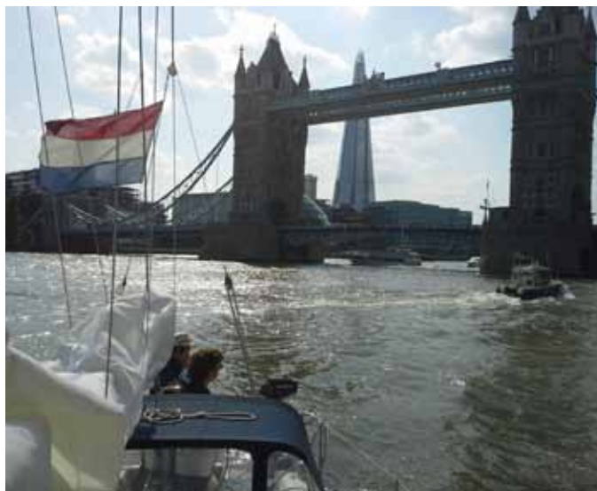
De iconische Tower Bridge

Na alle foto's 'die genomen moeten worden als je de Tower Bridge tegemoet vaart', en na het sluizen en vastleggen, ploffen we neer.