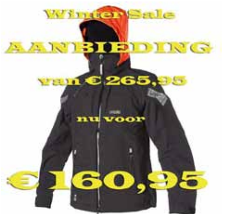
3L Coast Short Jacket

Geldig t/m 31 maart 2015, zolang de voorraad strekt!