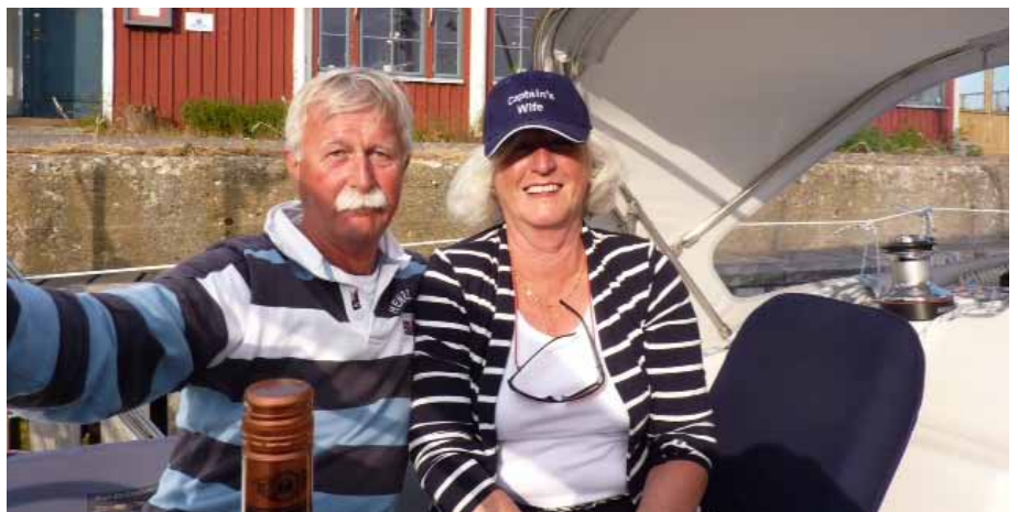
Wat was ik blij weer te kunnen zeilen

Met dank aan de adverteerders; Bomarine, Bosma Nautische Services, Brando Smit Yachtservice, Cantra B.V., De Koning Boegschroeven, Elvstrom Sails Benelux, Holland Marine Hardware, Holland Nauta, JFB, Kuiper Verzekeringen, L.V. Jachttechniek, Le Belle, Maritin Watersport, Nauticashop.nl, QSail / ETB GlassNSail, Rochmarine, Bavaria Yachtservice, SailSelect, Sailsspecials, Schepenkring, Seldén mid Europ BV, Shipshape, Studiostep, Yachting Company Muiderzand, Zeilmakerij De Vries Lemmer.