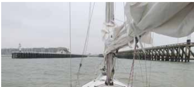
We varen langs de staketsels Blankenberge binnen

Toen we voor Scheveningen lagen, wilden we door! Het ging zo goed én het was nog vroeg in de middag. Tijd zat om naar Blankenberge te zeilen. Maar... gedoe voor de Maasmonding, doordat we moesten oploeven om een coaster te ontwijken, de gennaker moesten neerhalen en een afnemende wind. We verloren zoveel tijd, dat we kozen om naar Stellendam te gaan. Dat was -achteraf- niet zo'n goede keuze. Toch nog ruim 2 uur zeilen en dus werd het een late aankomst. De sluis bleek een echte attractie om mee te maken: groot, hoog en imposant. We gingen snel te kooi.