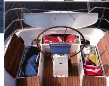
Stauraum im Cockpit Storage area in cockpit