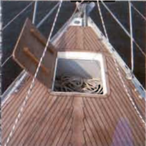
Zusätzlicher Stauraum hinter Ankerkasten Additional storage area behind anchor box