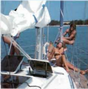
Doppelluke über Salon Double hatch above saloon