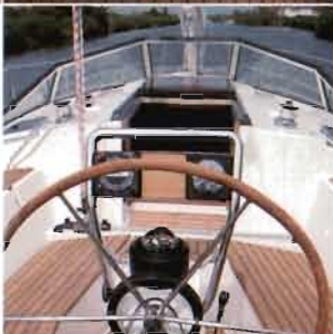
Cockpit mit Windschutzscheibe Cockpit with windshield