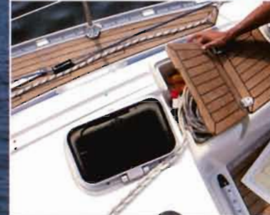
Staukasten für Fallen Storage box for halyards