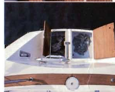
Badeplattform mit selbstlenzenden Heckankerkästen Swimming platform with self draining stern anchor boxes