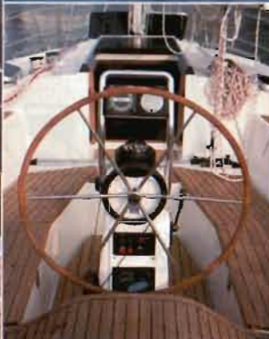
Steuersäule mit Instrumentenbord Steering pedestal with instrument panel