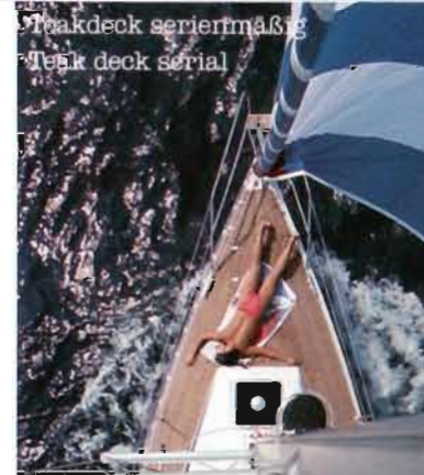
Teakdeck serienmäßig Teak deck serial